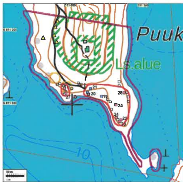
Koekuoppakartta. Kartalle on rajattu violetilla inventoitu kaava-alue ja keltaoransseilla ympyröillä on merkitty rakennuspaikkojen A ja B siirtokohtat = löydölliset koekuopat, 2022 Poutiainen = löydölliset koekuopat, 2000 Bilund = löydöttömät koekuopat, 2022 Poutiainen = raivausröykkiöt (muu havainto, ei muinaisjäännöksiä) Uusi muinaisjäännösraja punaisella

Ote inventointiraportin kartasta (s. 7).