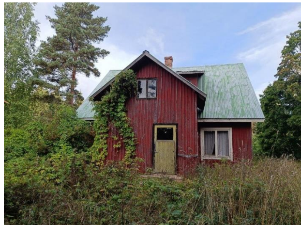
Kuva 3. Maatilan päärakennus vuodelta 1965 (vas.). Kuva 4. Vanhempi päärakennus vuodelta 1928 (oik.).

Ala-Taipaleentien pohjoispuolella ja järven rannan lähelle jäävät kaksi rantamökkiä (kuvat 5 ja 6 alla). Kyseiset rantamökit ovat peräisin 1970-luvulta ja ne ovat osin toimineet vuokrauskäytössä. Mahdolliset uudet rakennuspaikat sijoittuisivat lähinnä näiden kahden mökin väliselle alueelle.