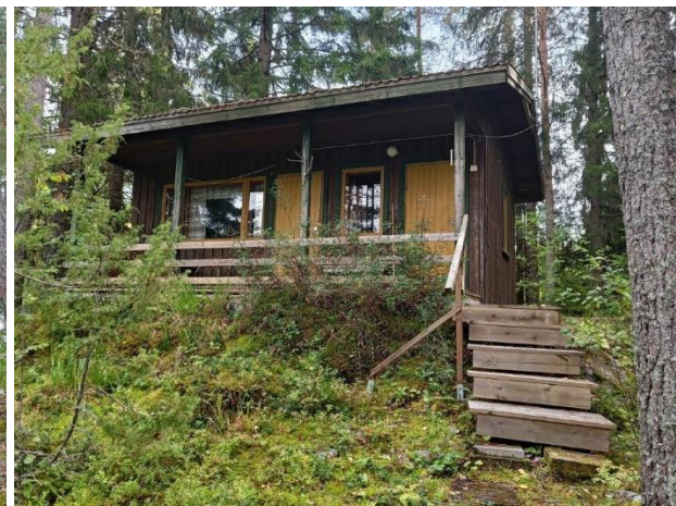
Kuva 5. Alueen lännenpuoleinen rantamökki (vas.), joka on tällä hetkellä vuokrattuna. Kuva 6. Idänpuoleinen rantamökki (oik.).