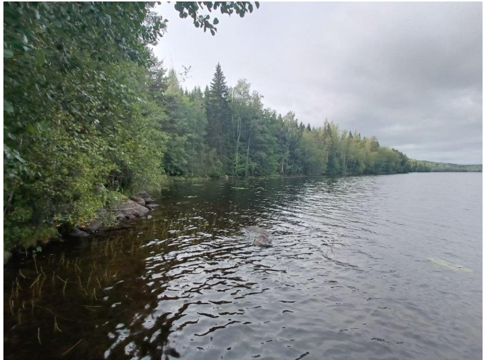
Kuva 1. Maisemaa suunnittelualan itäisen mökin rannasta kohti länttä.