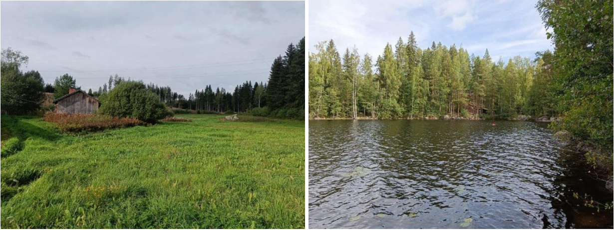
Kuva 7. Peltomaista maisemaa ja taustalla maatilan pihapiirin rakennuksia (vas.). Kuva 8. Maisemaa Ylisen Alijärven itäisen lahden rannasta (oik.).

Maatilan pihapiirin ympäristö on peltomaista (kuva 7). Tien eteläpuoleinen puusto on lähinnä tiheää sekataimikkoa sekä kesantopeltoa. Alueella on tehty luontoselvitys kesällä 2023 ja se löytyy kaavan selostuksen liitteistä.